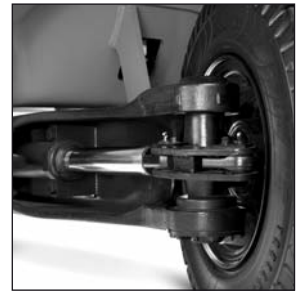
Eje de dirección para servicio pesado