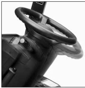
Responsive hydrostatic steering