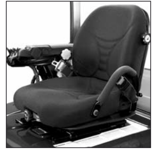
Asiento de vinilo con suspensión completa