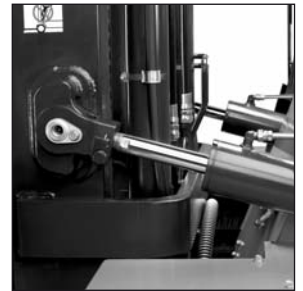
Cilindros de inclinación sellados