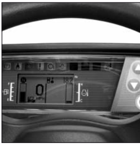
Premium LED/LCD information panel