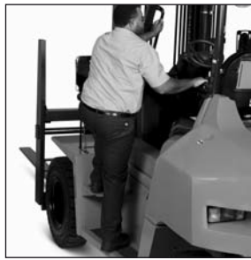
Easy access step and grab handle