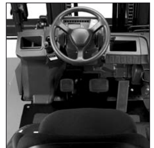
Compartimento espacioso para el operario