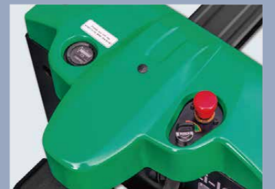
El cuerpo tiene líneas suaves, una enorme sensación de movimiento y un perfil compacto, en consonancia con la actual tendencia de diseño del aspecto.