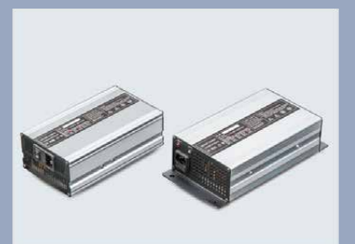
El cargador tiene un cuerpo compacto y es fácil de transportar.