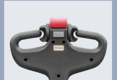
La función de gestión del timón vertical permite trabajar dentro de un espacio muy reducido, como puede ser un contenedor.