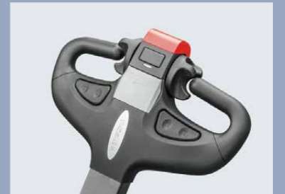
El timón modular es simple pero confiable y bonito, todas las piezas que contiene se pueden reemplazar por separado y todas las operaciones se pueden hacer fácilmente con una sola mano.