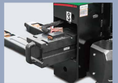
Batería fácilmente reemplazable